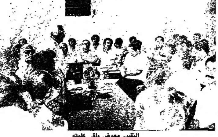
التعبير معوض ياتي كتمت